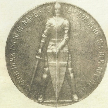
Rückseite für 45 mm Med