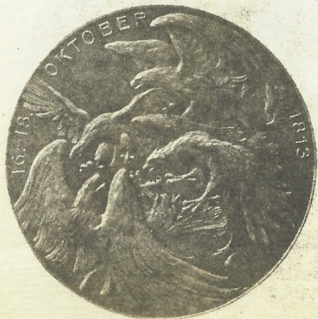
Rückseite für 60 mm Medaillen