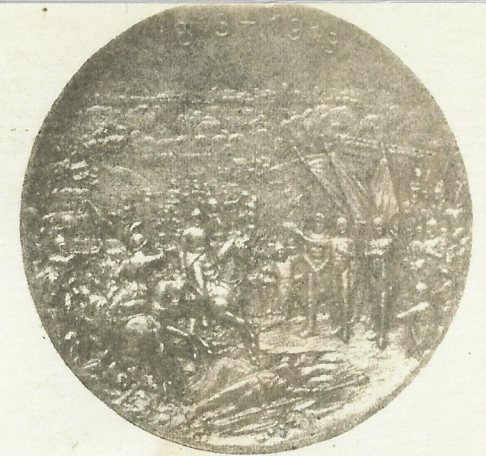
Rückseite für 60 mm Medaillen