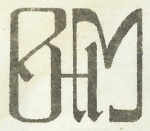
Ges. Gesch. Fabrikmarke