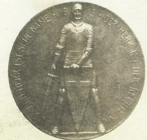
Rückseite für 60 mm Medaillen