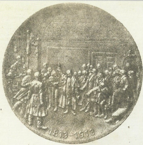
Rückseite für 60 mm Medaillen