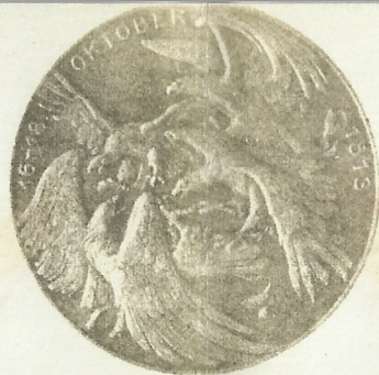
Rückseite für 45 mm Med.